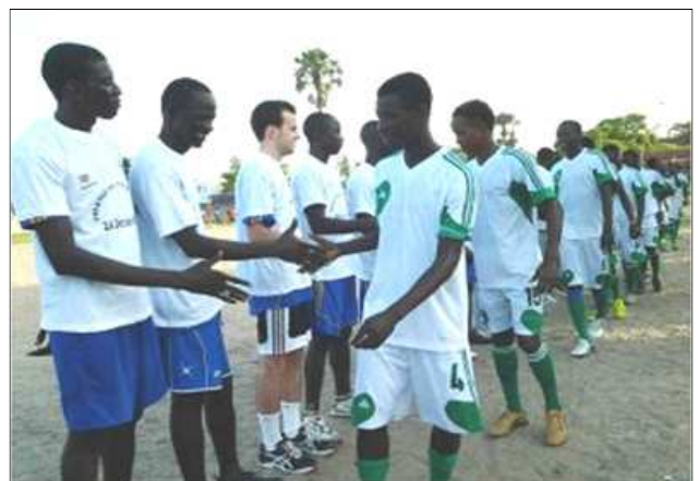
Match de Football SNU et Administration au Casa Sport

Dans l'après-midi, un match amical de football a opposé l'équipe du Système Nations Unies (SNU) et de l'Administration contre le Casa Sport, l'équipe fanion de la région de Ziguinchor. Score final 2 buts contre 1 en faveur de l'équipe du Casa Sport.