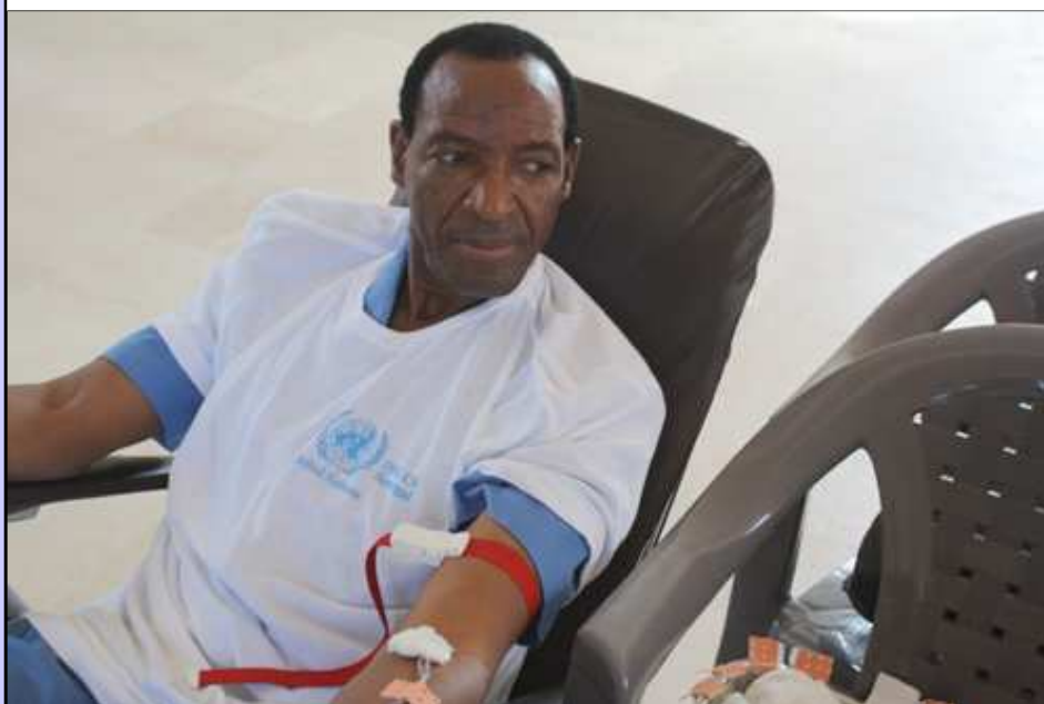
Un fonctionnaire de l'ONU donne son sang

Dés 9 heures du matin, ce 24 octobre, la place du souvenir à Dakar a accueilli une foule immense de personnes venues donner leur sang. L'Organisation des Nations-Unies au Sénégal avait choisi d'organiser une collecte de sang en partenariat avec le Centre National de Transfusion Sanguine (CNTS) pour marquer la célébration de la journée des Nations-Unies.