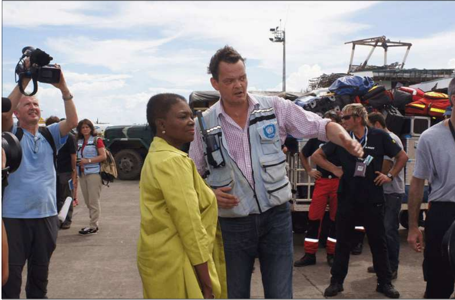
La Coordinatrice des secours d'urgence, Valérie Amos, s'entretient avec des survivants du super typhon Haiyan, dans la ville de Tacloban.

Plus de 11 millions de personnes ont été touchées par ce que l'Organisation météorologique mondiale (OMM) considère comme la tempête tropicale la plus puissante de l'année et l'une des plus puissantes jamais enregistrée.