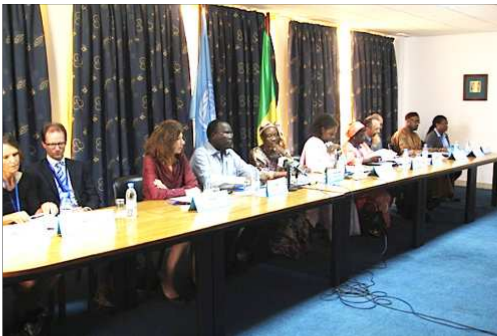
Les Chefs d'Agence du Système des Nations Unies au Sénégal devant la presse

Autour du Coordonateur Résident, plusieurs chefs d'agences du système des Nations Unies au Sénégal ont tenu une conférence de presse commune ce matin au PNUD à Dakar. Devant les journalistes, ils ont fait l'état des lieux au Sénégal et dans le monde des Objectifs du Millénaire pour le Développement (OMD) et annoncé le Post 1015. Cette rencontre était inscrite au programme de la célébration de la semaine des Nations-Unies et de la journée du 24 octobre, date anniversaire de la création de l'organisation mondiale.