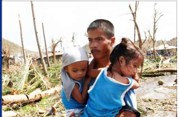
Un homme tient ses enfants dans ses bras à Tacloban, après le passage du super-typhon Haiyan.

L'Organisation des Nations Unies a lancé, le mardi 12 novembre 2013, un appel d'un montant de 301 millions de dollars pour fournir une aide aux régions des Philippines les plus durement touchées par le super typhon Haiyan, alors que les personnels humanitaires travaillent sans relâche pour distribuer aux survivants des articles de première nécessité.