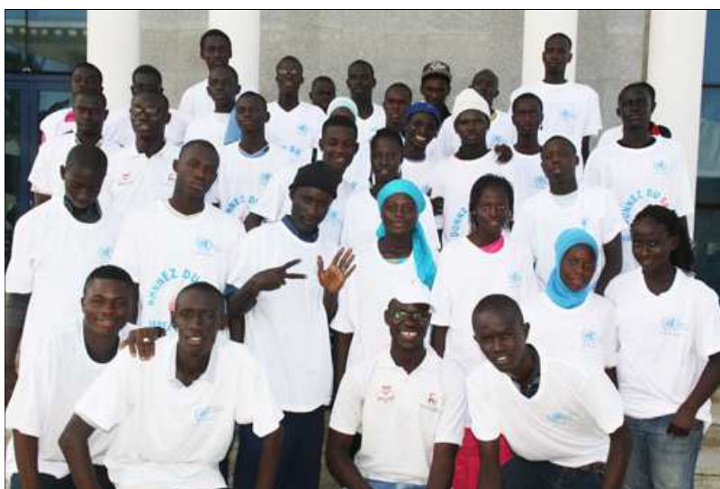
La jeunesse s'est mobilisée pour le don de sang

Le Centre National de Transfusion Sanguine chargé de la collecte avait dépêché sur place son personnel technique composé de médecins, d'infirmiers et de restaurateurs. Ces derniers ont été très appréciés par les donateurs qui, en fin de parcours après le prélèvement, ont pu rapidement récupérer des forces.